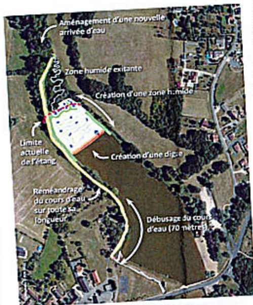
Idees d'aménagement dans la zone humide et chemin piétonnier imaginé